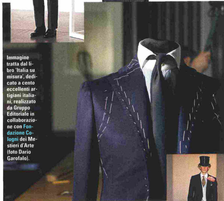
Immagine tratta dal libro 'Italia su misura', dedicato a cento eccellenti artigiani italiani, realizzato da Gruppo Editoriale in collaborazione con Fondazione Collogni dei Mestieri d'Arte.