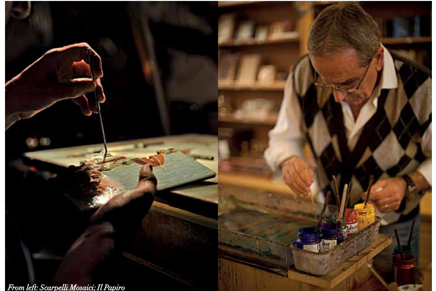
From left: Scarpelli Mosaici; Il Papiro