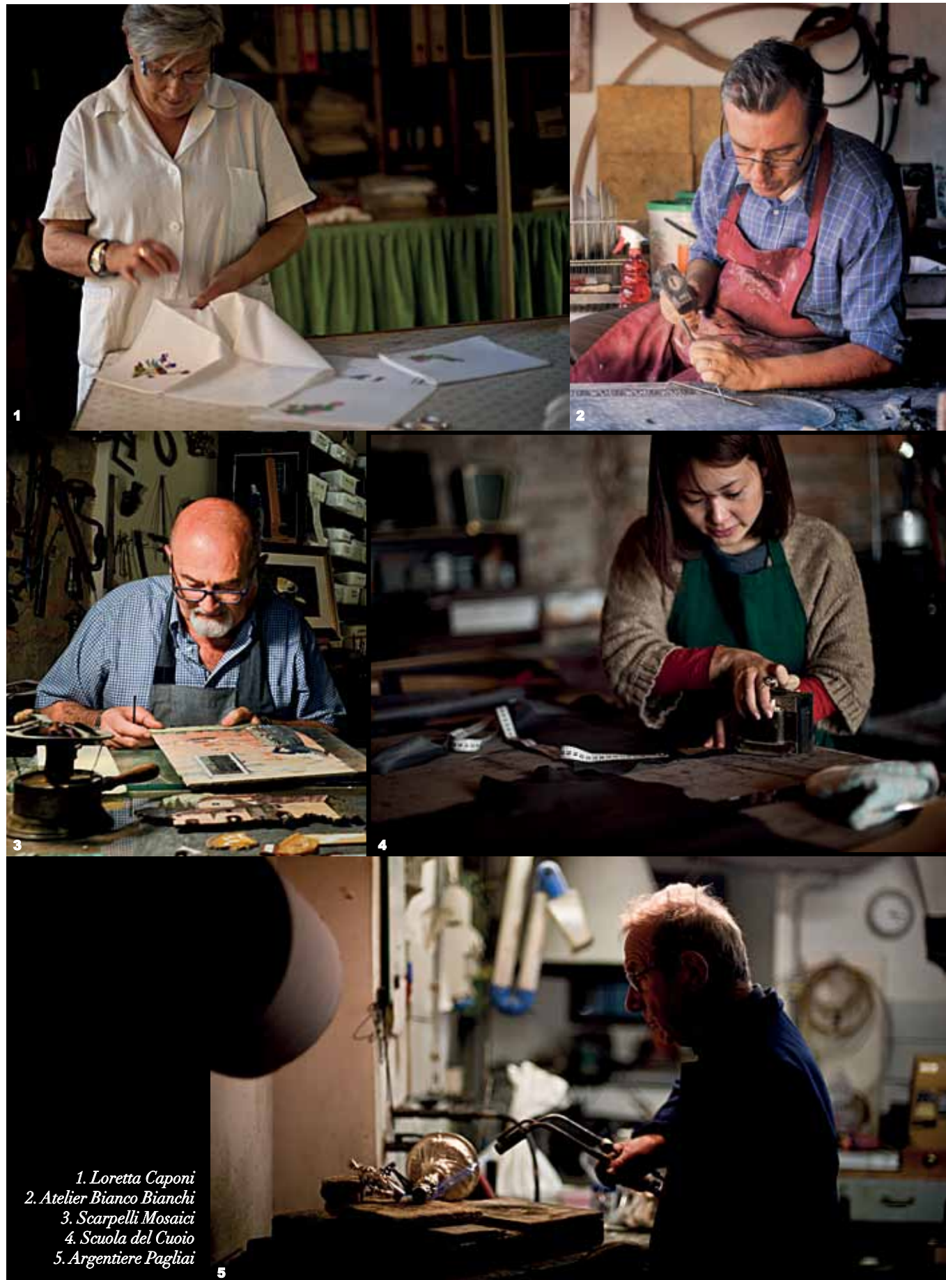
1. Loretta Caponi 2. Atelier Bianco Bianchi 3. Scarpelli Mosaici 4. Scuola del Cuoio 5. Argentiere Pagliai