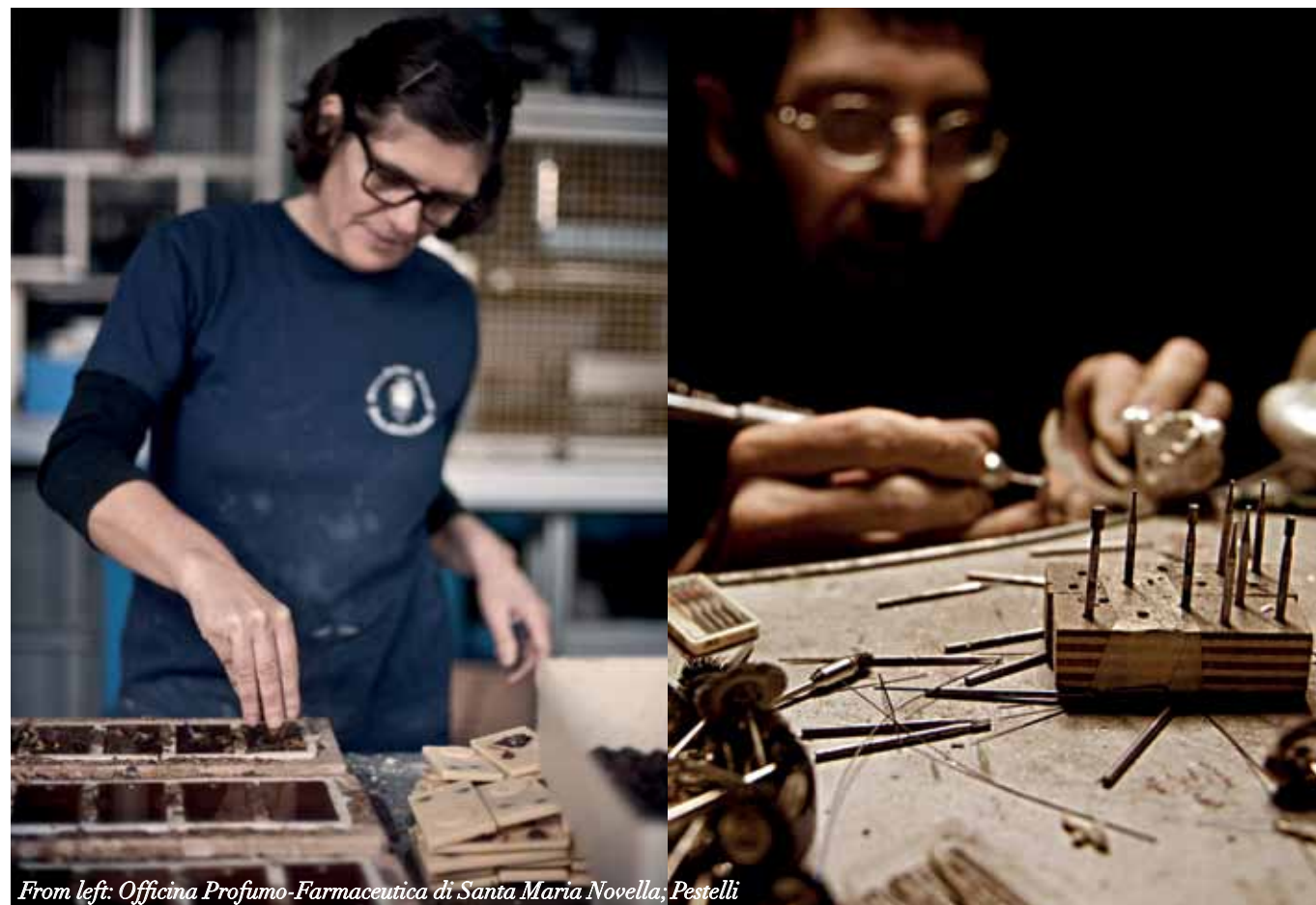
From left: Officina Profumo-Farmaceutica di Santa Maria Novella ; Pestelli

Among the artisans featured in the guide, 12 are based in Tuscany, 11 of whom are in Florence